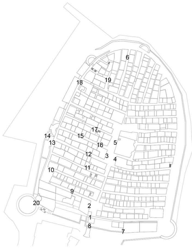
GRBOVI vrste, pozicije